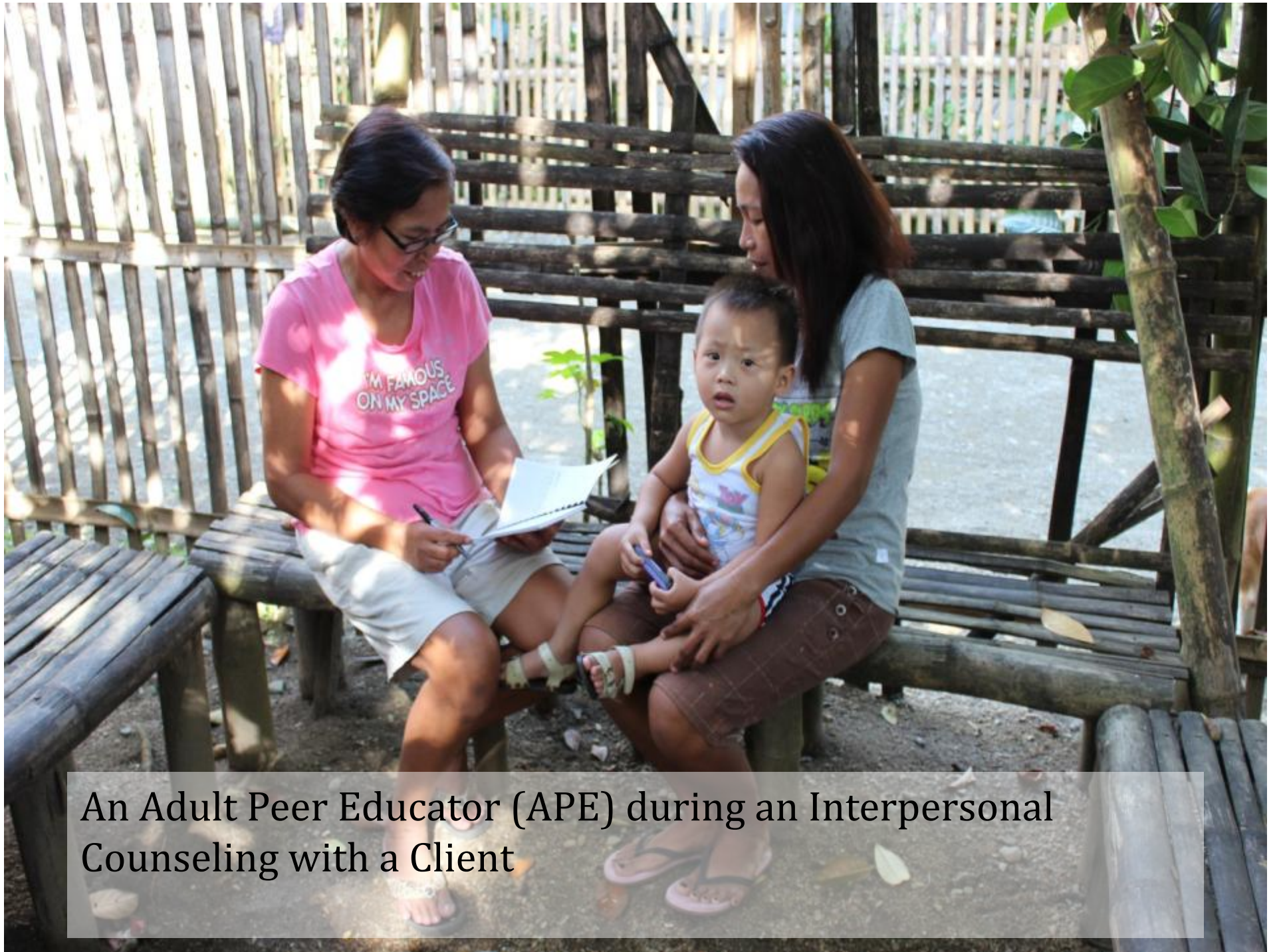
An Adult Peer Educator (APE) during an Interpersonal Counseling with a Client