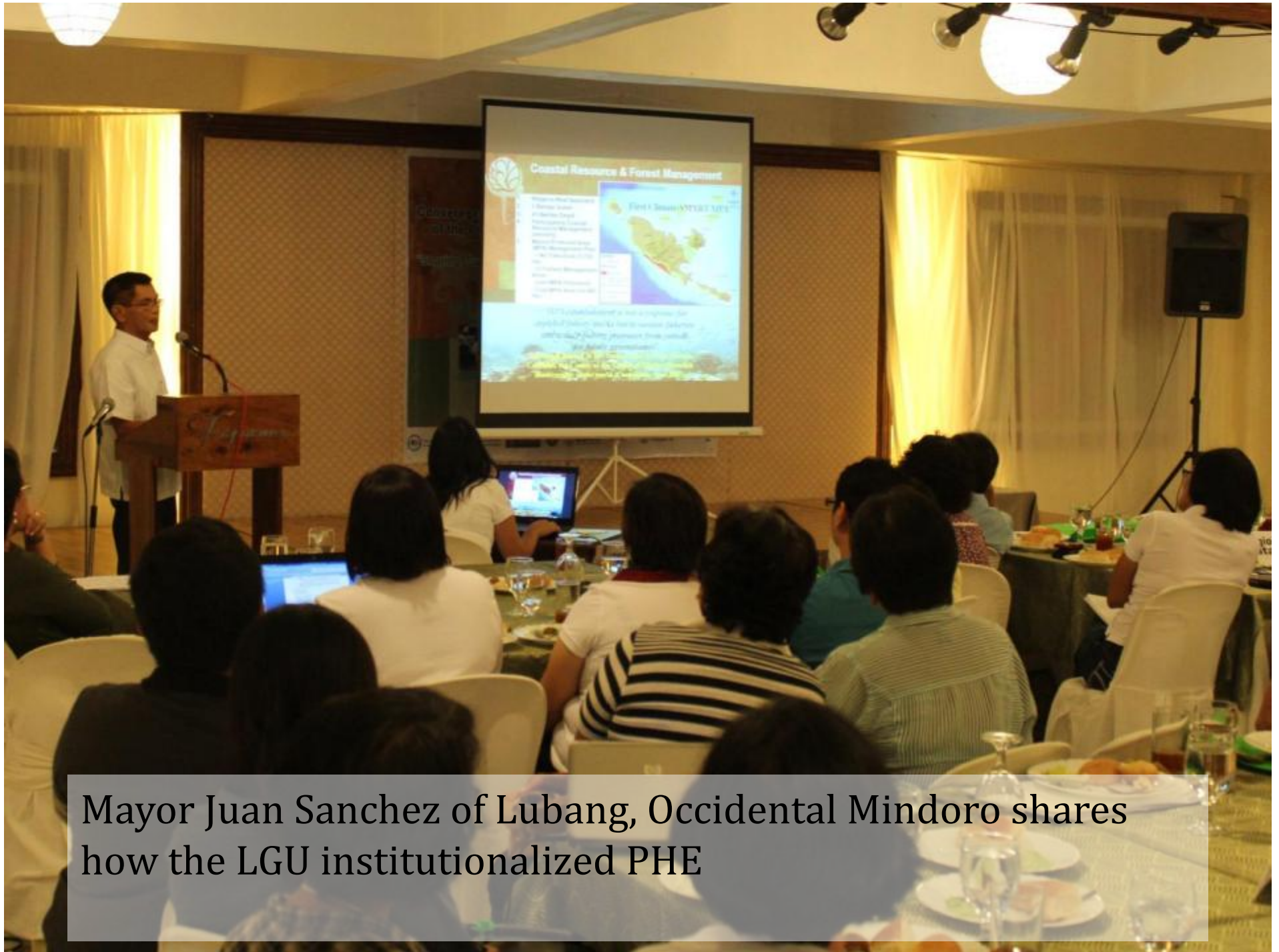
Mayor Juan Sanchez of Lubang, Occidental Mindoro shares how the LGU institutionalized PHE