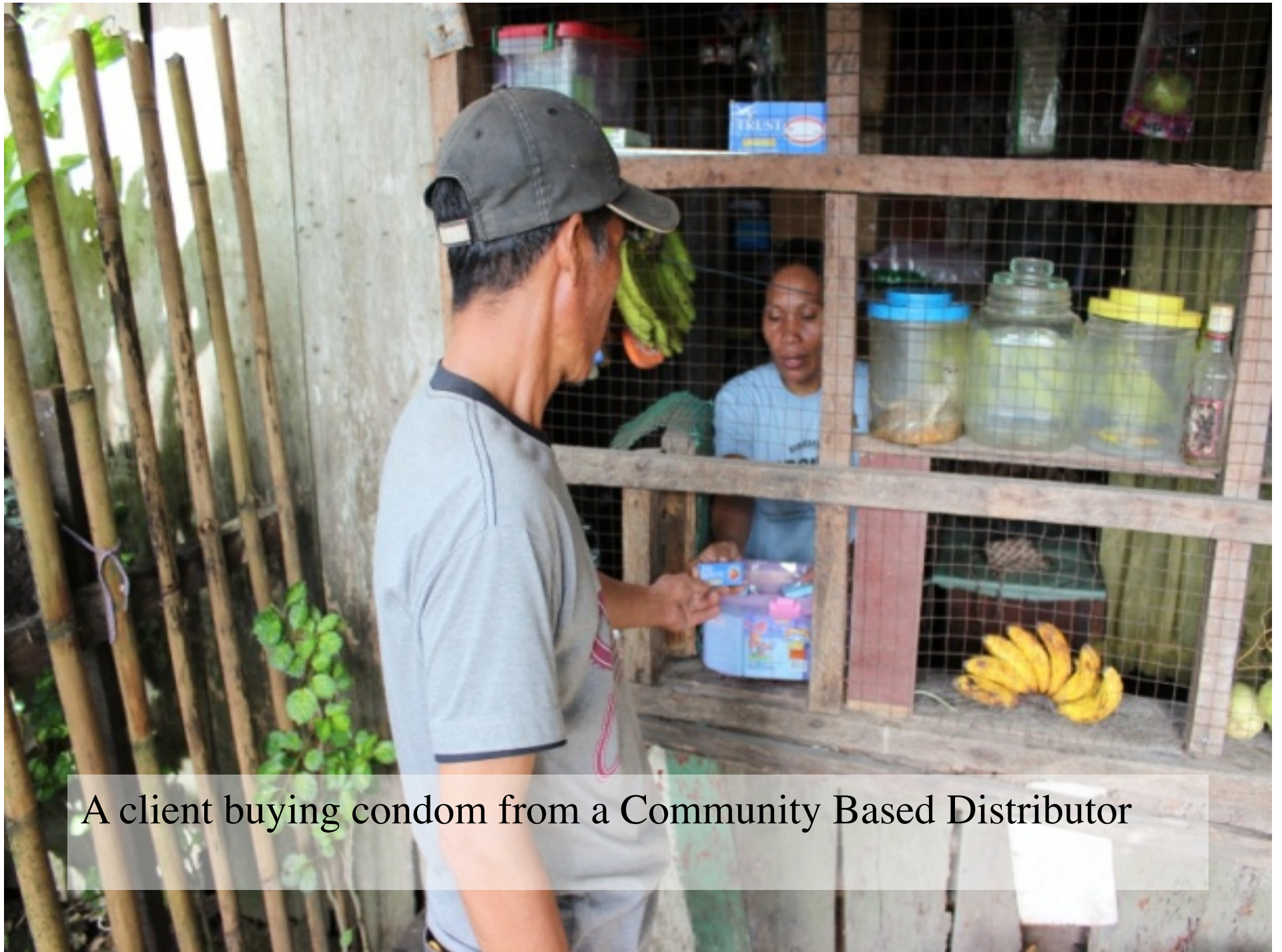
A client buying condom from a Community Based Distributor